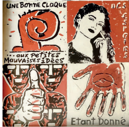
MISS.TIC / PAELLA / V.L.P.