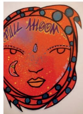
CHARLIE ART CLYDE